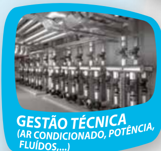
GESTÃO TÉCNICA (AR CONDICIONADO, POTÊNCIA, FLUIDOS,...)