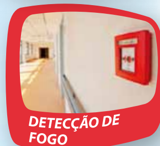
DETECÇÃO DE FOGO