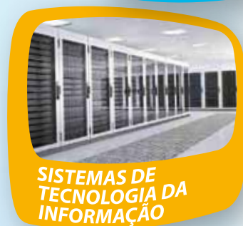
SISTEMAS DE TECNOLOGIA DA INFORMAÇÃO