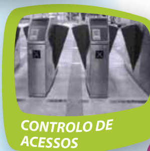
CONTROLO DE ACESSOS